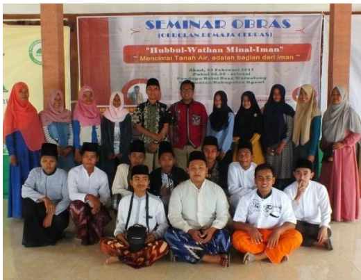
Seminar "Hubbul Wathan Minal Iman" yang diadakan Riswa pada Februari 2017