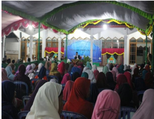
Pengajian Malam Cinta Rosul yang diadakan RISWA pada Desember 2016