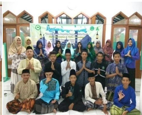
Pelaksanaan "Pesantren Kilat" selama 3 hari di awal bulan ramadhan Juni 2017