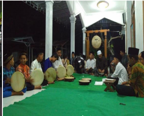
Rutinan MATAPU (Malam Tadarus Puisi) setiap malam minggu yang diadakan RISWA