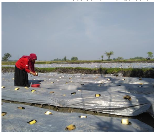
Berwirausaha petani melon yang dikenalkan orangtua (Hikmawati, 2016)