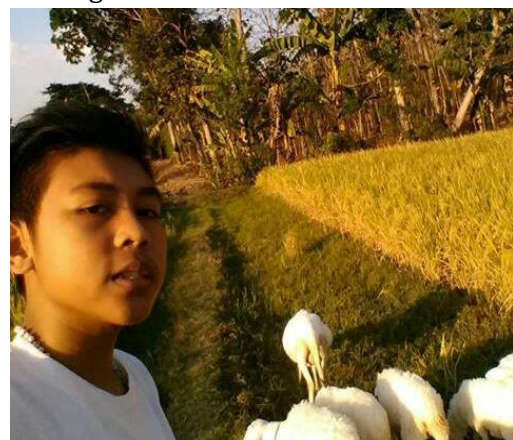
Santri Asybaabul-Ghufron sekaligus Remaja Islam Watualang (RISWA) yang berwirausaha berternak kambing